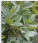
Plantes et le gazon