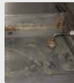
Plaque à griller