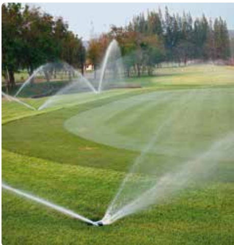
Installation de sprinklers sur un terrain de golf