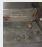
Plaque à grillade