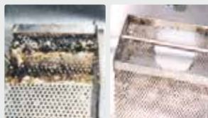
Séparateurs de graisses