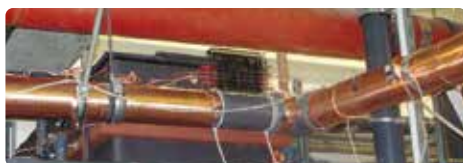
Vulcan S250 installé à l'hôpital St. Joseph

Nous pouvons véritablement recommander l'appareil installé par Christiani Wassertechnik GmbH ... »