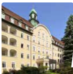
Hôpital St. Joseph, Berlin