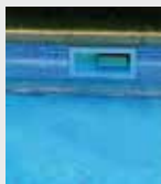
Ligne d'une piscine