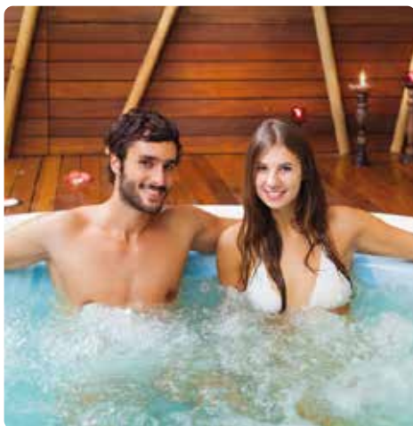
Bain bouillonnant d'une installation de bien-être