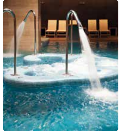
Piscine thermale à base d'eau de mer

Les piscines sont des systèmes en boucle semi-ouverts qui souffrent constamment des pertes d'eau à mesure que leur eau s'évapore. Les piscines demandent un entretien constant et nécessitent d'ajouter différents produits chimiques pour lutter contre les bactéries, les algues et conserver une bonne qualité d'air, conformément aux normes imposées. Vulcan améliore nettement la qualité de l'eau et renforce les propriétés de certaines substances.