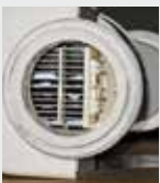
Filtere de piscine