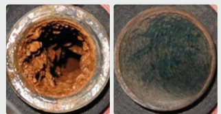
Biofilm présent sur un tuyau