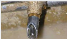
Abreuvoir parfaitement propre