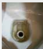
Cuvette de toilette