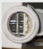
Filtere de piscine