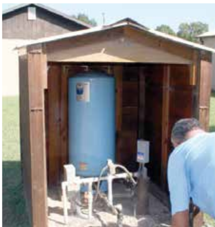
Système d'approvisionnement en eau de forage domestique