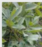
Plantes et jardins