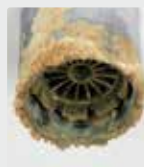
Buse des robinets