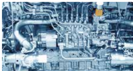
Appareils ménagers (en haut) Moteur de bateau (en bas)

Moteurs : Vulcan contrôle les dépôts de tartre dans l’eau des chambres de refroidissement, sur les lignes de transfert ou dans les refroidisseurs/chambres de refroidissement. Vulcan limite la formation de calcaire dans les échangeurs thermiques (production d’eau chaude) ou dans les chambres de chaleur des moteurs.