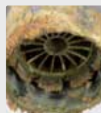
Buse des robinets