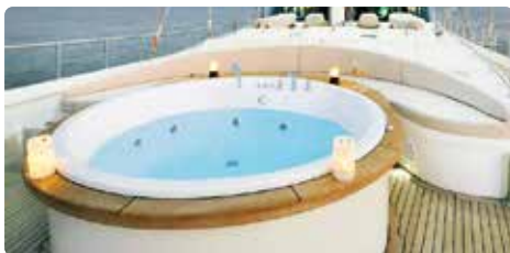
Jacuzzi sur le pont d'un yacht de luxe.