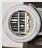
Filtre de piscine